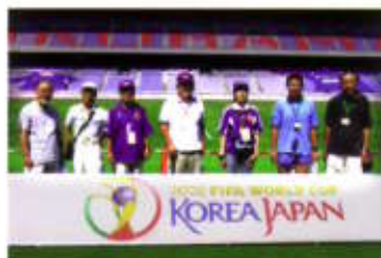
8/3のスタジアムツアーによこはま2002の会員を率えて出かけ、憧れのピッチで写真を撮りました!この日は新横浜パフォーマンスがあったため、特別にW杯の看板の前で撮影できました。

当日は体育の日にちなんで種々のイベントが開催されます。各種イベントは自由参加ですので競技場見学の後、個人参加でお楽しみ下さい。イベントの内容は、サッカーボールによるキックターゲットやリフティング、フォークダンス、ウォークラリー、スポーツ・チャンバラ等々、楽しみが一杯!