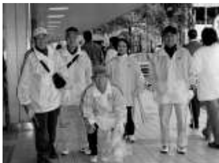
左：新横浜町内会の方からお礼の言葉もいただいた清掃活動。

今回の「よこはま2002」の活動は12月2日と12月16日の産経新聞、12月11日の朝日新聞(どちらも横浜版)に大きく取り上げられました。記事はホームページに転載しましたのでご覧ください。