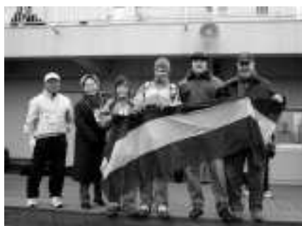
右：憧れの練習会場に興奮！ボカ・ジュニアーズのサポーターと小机競技場で記念写真。