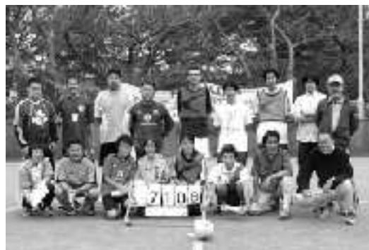
フットサルに参加のみなさん。元気あふれるプレーの連続でした！

ドリームランド跡地は桜の名所なので、「次回はお花見の季節に！」との声もあがっています。また、今回はフットサルの参加者に経験者が多くレベルが高かったのですが、初心者でも次回は楽しめるようにしようとの話も持ちあがりました。すでに今回の「よくばり企画」から、次回の企画が芽生えています。みなさん、どうぞお楽しみに。