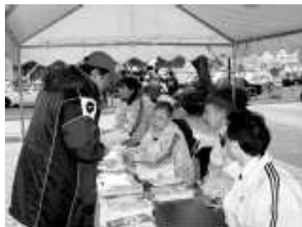
新横浜駅前の案内テント。たくさんのお客様に対応しました。

試合前の練習会場での通訳も評判が良く、試合当日サッカー協会から直接指名を受けた人もいました。練習会場の一般ボラはほとんどキャンセルになってしまい、応募していただいた方々にはたいへんご迷惑をおかけしました。また練習時間が決まるのが前日だったため連絡がぎりぎりになり申し訳ありません。