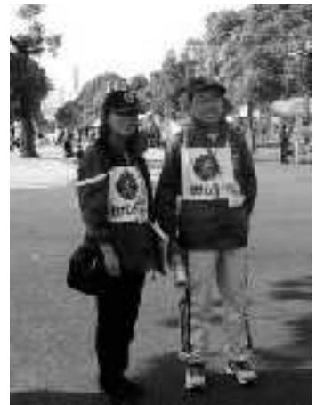
山下公園でウォーカーに観光案内をしました。

ガイドマニュアルを作り、にわか勉強でしたがみなさん大張り切り。ところが主催者が私たち観光ガイドの存在を参加者に告知してくれなかったため、誰も話しかけてくれません。ほとんどのウォーカーが景色には目もくれず黙々と歩いていました。会の活動としてはちょっと拍子抜けでしたが、来年度はもっと横浜の街を楽しんで帰ってもらえるような大会にできるように、主催者側へ提言する予定です。