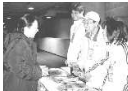
東アジア大会にて、笑顔でプログラム販売。

競技場内のプログラム販売には年齢制限を設けたにもかかわらず「年齢は上だが体力に自信あり」の方も多く応募され、若い方たちに混じってがんばっておられました。ほかの団体と一緒に活動していただいたため、一部に遊び気分の学生などもいたとのことですが、プログラム販売はサッカー協会の管理下にあり、当会ではコントロールすることができませんでした。